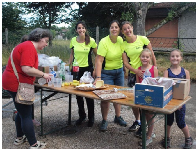
Des dirigeants à la table de ravitaillement