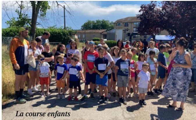
La course enfants