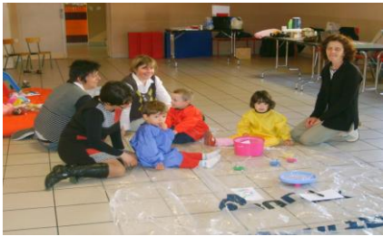
Peinture à l'essoreuse à Bettant