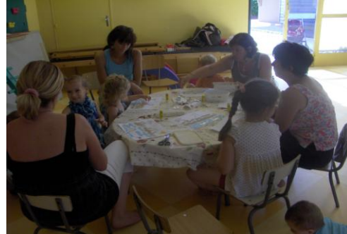
Activité collage divers pour tableau été à Ambronay