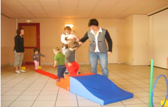
Psychomotricité à Bettant

Nous vous invitons à découvrir quelques activités réalisées pendant les temps collectifs.