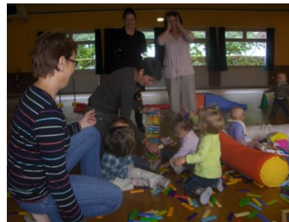
Construction en kapla à Château Gaillard