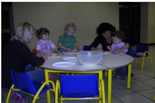
Atelier Pâtisserie à St Denis