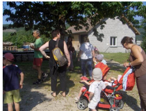
Sortie escargotière à Lhuis