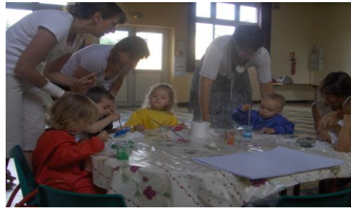
Peinture sur galets à Douvres