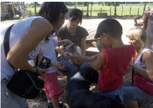
Sortie ferme pédagogique à St André le Bouchoux